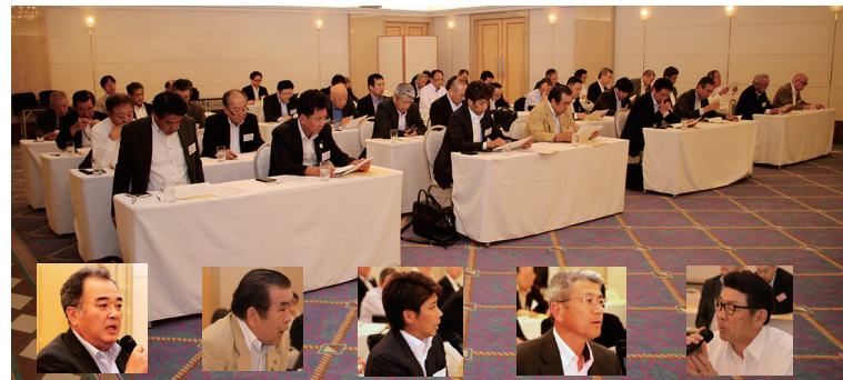
全国から参集した全海運役員と質疑応答の発言者