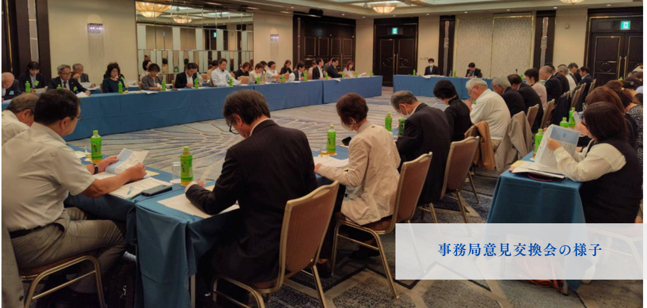
事務局意見交換会の様子