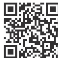
備讃瀬戸海上交通センターHP