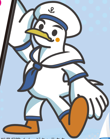
船員保険イメージキャラクター かもめっせ