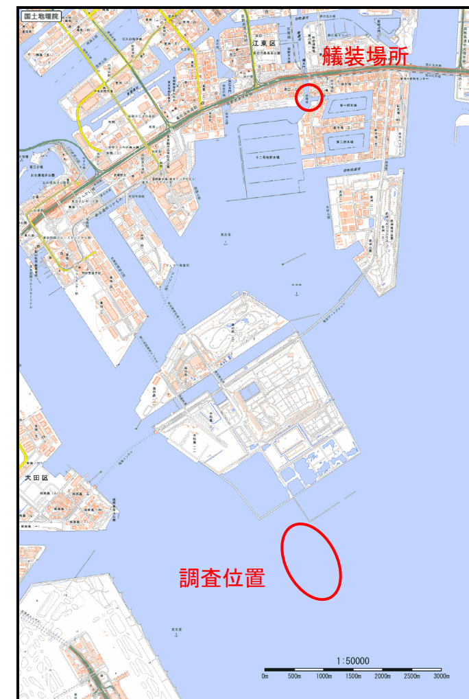
図-2 調査位置案内図